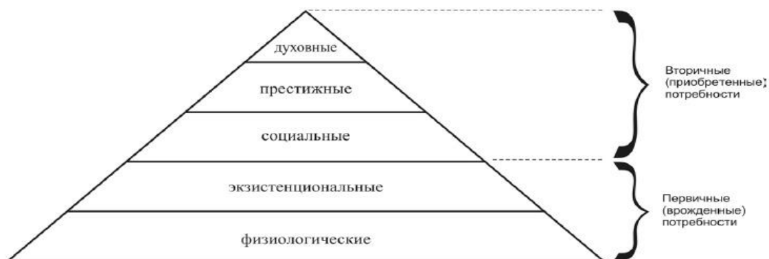
Рис. 11.1. Пирамида потребностей по А. Маслоу

Если предшествовавшие перечни потребностей подразумевали, что человек, испытывающий одну из потребностей, не может в то же самое время испытывать другую, то А. Маслоу подчеркивал, что отношения между потребностями не подчинены принципу взаимоисключаемости. Напротив, они так тесно переплетены друг с другом, что отделить одну от другой практически невозможно. Схематично иерархия базовых потребностей представлена на рис. 11.1.